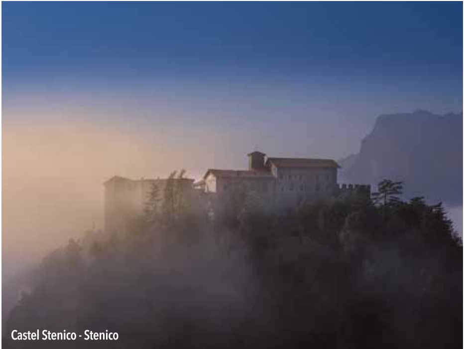
Castel Stenico - Stenico