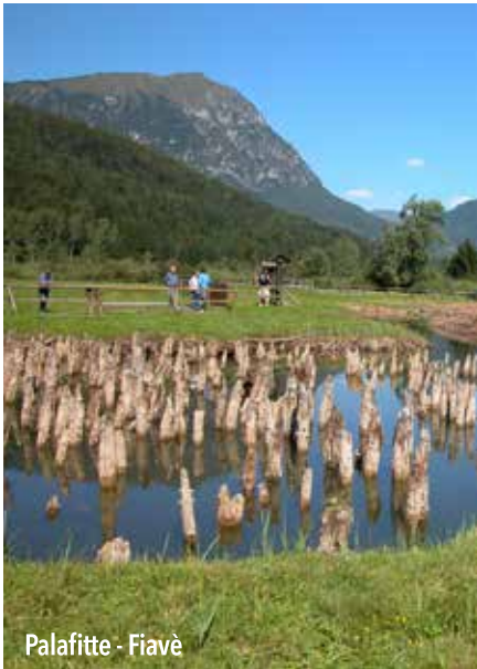
Palafitte - Fivè